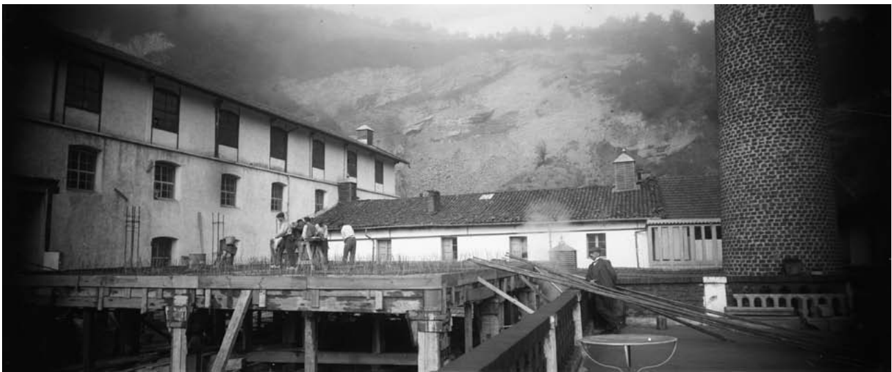
Txaramako paper lantegiaren eraikuntza. (Aranzadi Z.E.)