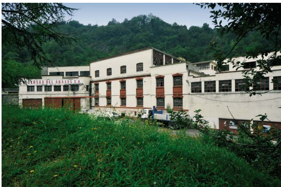
xx. mendearen hasieran eraikitako eraikinak, hormigoizkoak; arku eskartzanoak eta adreiluzko hari apaingarriak nabarmentzen dira. (Santi Yaniz)

Junto al área productiva propiamente dicha se conserva parte de los edificios de viviendas para los obreros: las casas Ibai Gain y Atari Eder, cuya construcción se hizo necesaria por la lejanía al casco urbano de Tolosa. La fábrica contó con una casa para sus obreros y un frontón a pocos metros de la capilla de San Luis ambos ya desaparecidos.