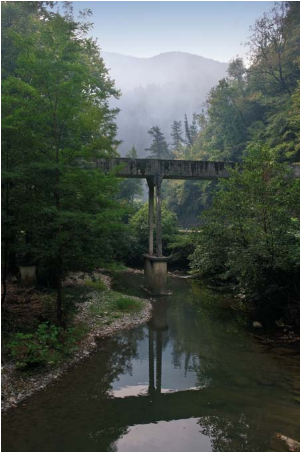
Azpiegitura hidraulikoaren ubidearen akueduktua, hormigoi armatzukoa, erre-pidea Nafarroarantz zeharkatzen duena. (Santi Yaniz)

Acueducto del canal de la infraestructura hidráulica construido en hormigón armado que cruza la carretera hacia Navarra. (Santi Yaniz)