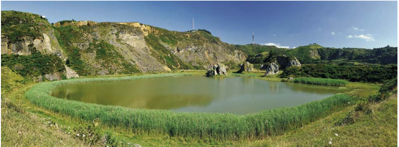
Urtegia La Unióneko antzinako meategian, meatzarien herrixkatik hurbil. (Santi Yaniz)