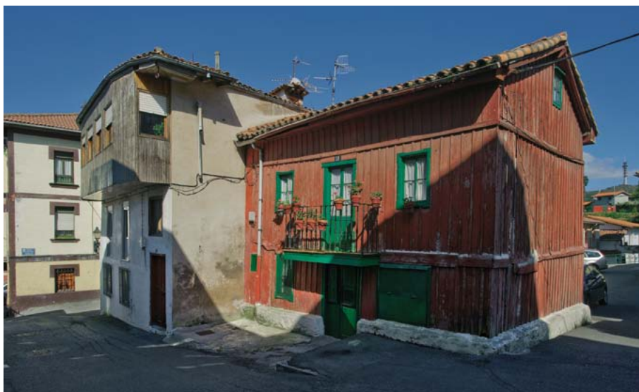
Zugaztietako zurezko etxea. Eraldatuz joan da hasierako eredia, eta aldaketak sartu dira egituran, eraikuntzako materialetan edo barne banaketan.