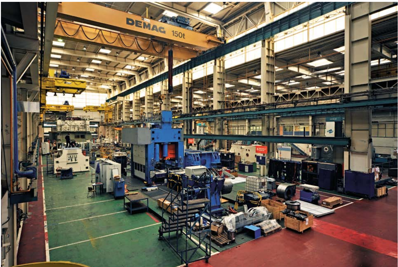
Gardentasuna eta argitasuna produkzio-nabearen barrualdean. (Santi Yaniz)

La empresa –inscrita como Sociedad Industrial dedicada a la fabricación y venta de maquinaria, troqueles y herramientas y cuantas actividades industriales decidiera emprender,– contó pronto con 17 nuevos socios que contribuyeron a aumentar su capital y darle el impulso definitivo. Continuando con la actividad de Aranzabal y Cía., se dedicaron a la estampación de piezas metálicas para el